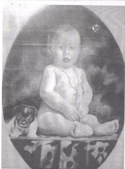
Από έργο που εκτίθεται στο Καφέ της Τέχνης, με τίτλο "Πορτρέτο μικρού παιδιού", Α. Der Hagerian, 1924, Κερκυραϊκή Πινακοθήκη