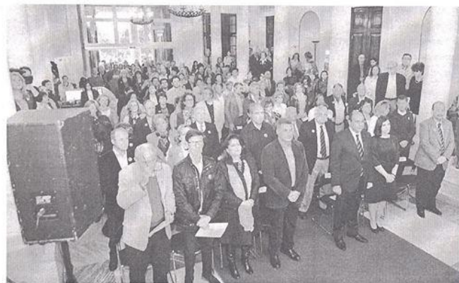
Κατάμεστη η αίθουσα των προπυλαίων στην εκδήλωση μνήμης