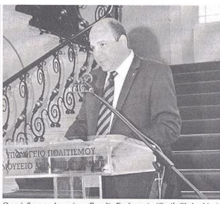
Ο πρόεδρος της Αρμενίας κ.Γκατζίκ Γκαλατσιάν (Gagik Ghalatchian), ομιλητής στην εκδήλωση