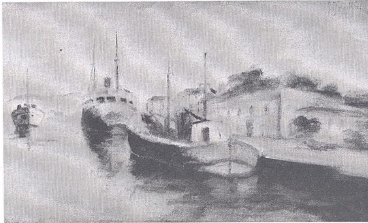
Έργο του Νίκου Ζερβού

Η Κερκυραϊκή Πινακοθήκη ιδρύθηκε πριν από δέκα χρόνια από τον Μιχαήλ Άγγελο Βραδή, δίνοντας έτσι ζωή στο όραμα ενός συλλέκτη δεκαετιών, με πολλή αγάπη και σεβασμό στην τέχνη. Βασικός του στόχος ήταν να δημιουργηθεί ένας χώρος πολιτισμού, που θα καταγράφει και θα αναδεικνύει την καλλιτεχνική πορεία της Κέρκυρας τους τελευταίους δύο αιώνες. Σε αυ-