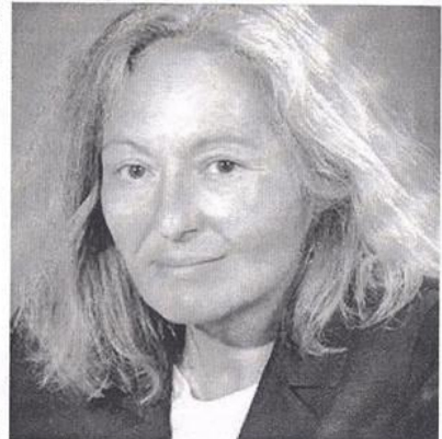
-Ποιος είναι οι επόμενες δράσεις σας;

Ο δρ. Ιστορίας της Τέχνης Θάνος Χρήστου έχει γράψει για την ζωγράφο «Κινοούμενη στα όρια των σουρεαλιστικών κατευθύνσεων, μετασχηματίζει οράματα και εικόνες του ασυνειδητού σε συνθέσεις γεμάτες δυναμισμό και εσωτερικότητα».